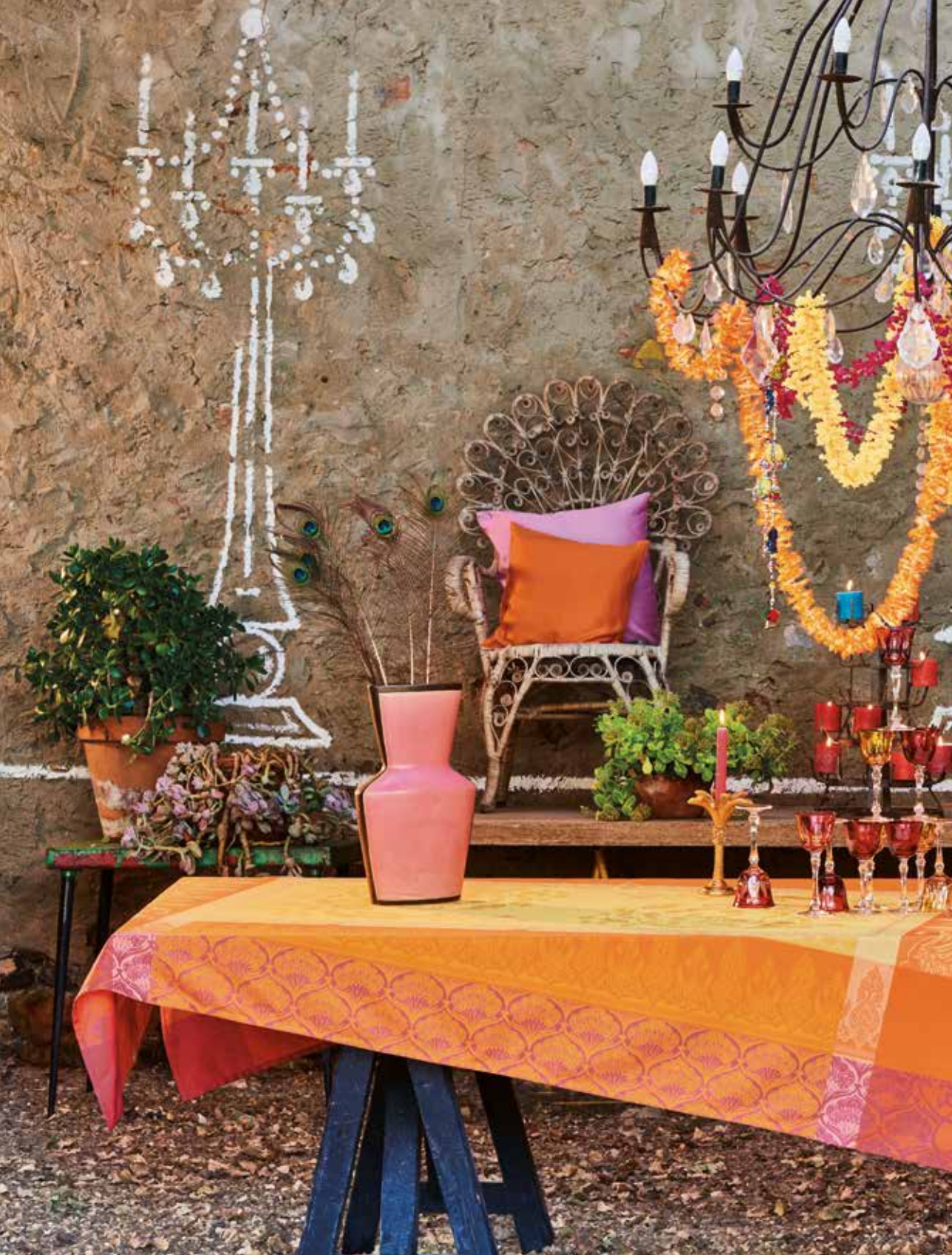
Shambala épices - 100% coton damassé / 100% damask cotton