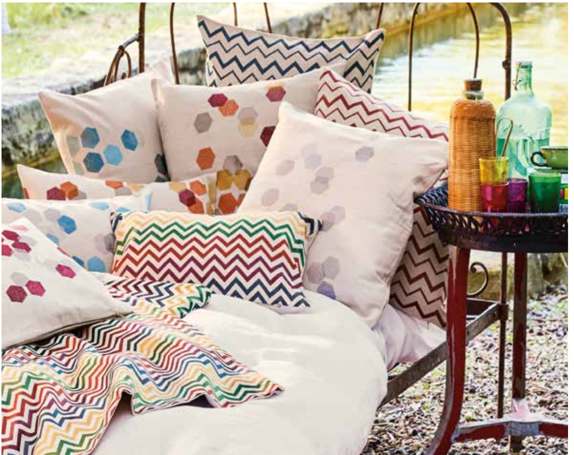
Coussins Zig Zag & Hexagones