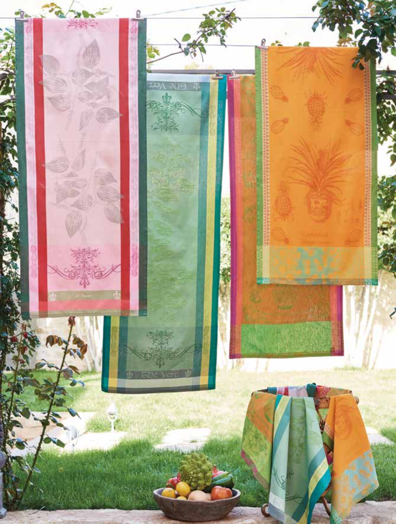
Brin de poivre rose - Brin de thé vert - Mandarinier en pot orange - Ananas en pot jaune soleil 100% coton damassé / 100% damask cotton