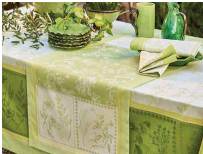
Herbora prairie - 100% coton damassé / 100% damask cotton