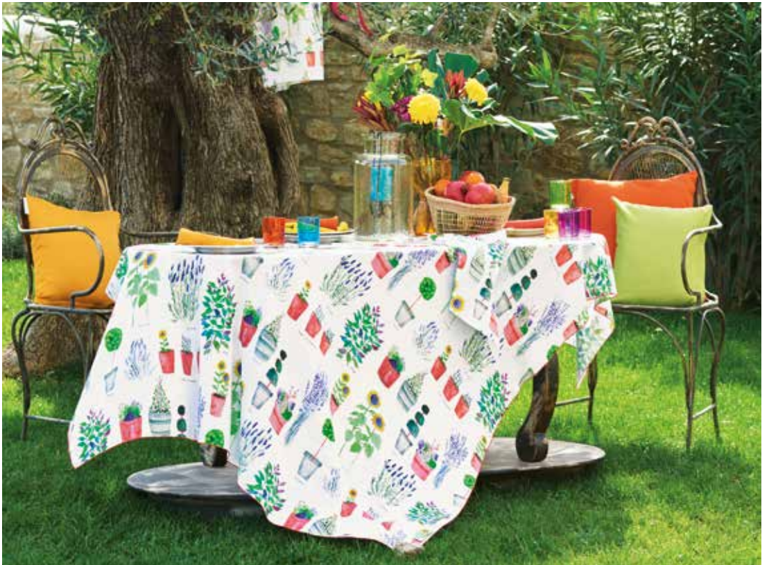
Mille fraisières printemps & Mille pépinières floraison - Métis imprimé lavé (nappes) / pre-wash printed half linen (tablecloth) Torchon & tablier - 100% coton imprimé / Kitchen towel & apron - 100% printed cotton