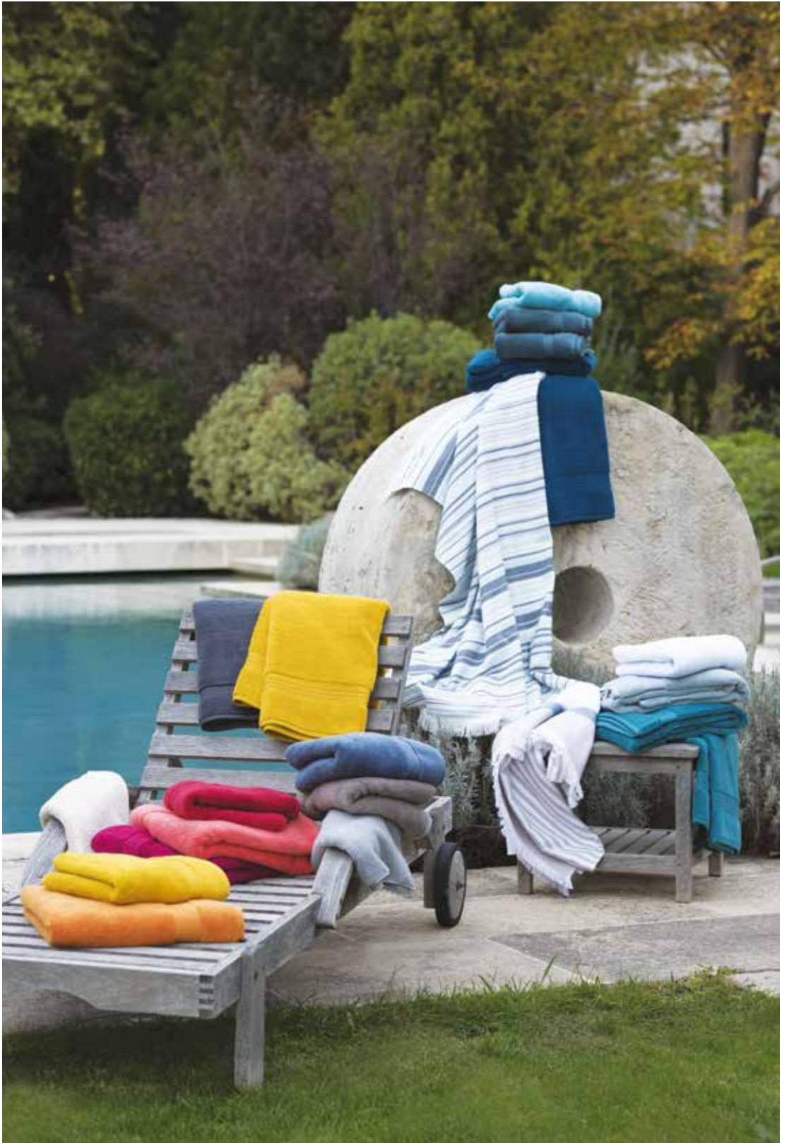
Éponge Éléa, Foutas Faro bleu & Olbia lin - 100% coton / 100% cotton