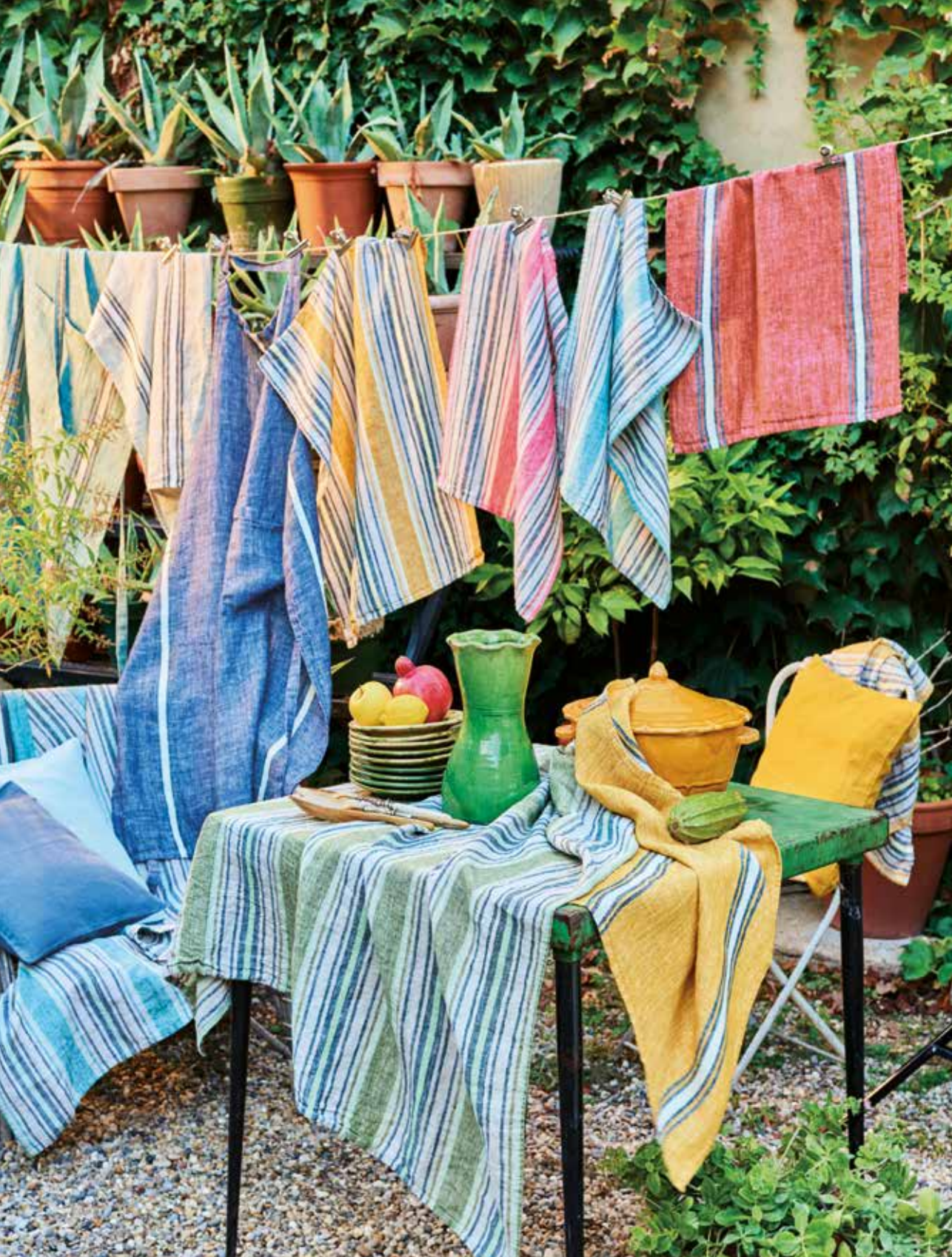
Sombrilla & Costa - 100% lin lavé / 100% pre-wash linen