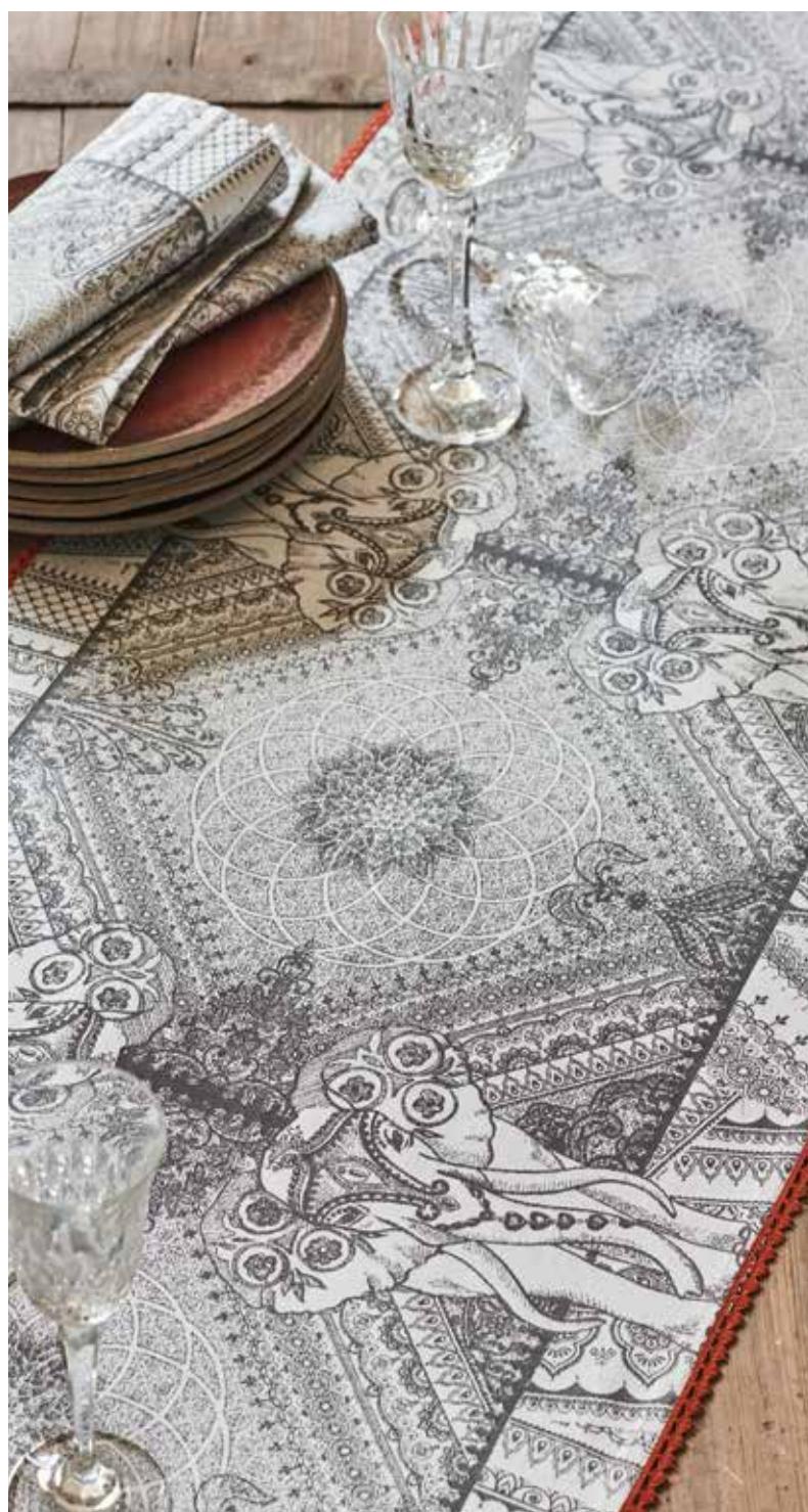
Jodhpur noir - 100% coton damassé / 100% damask cotton