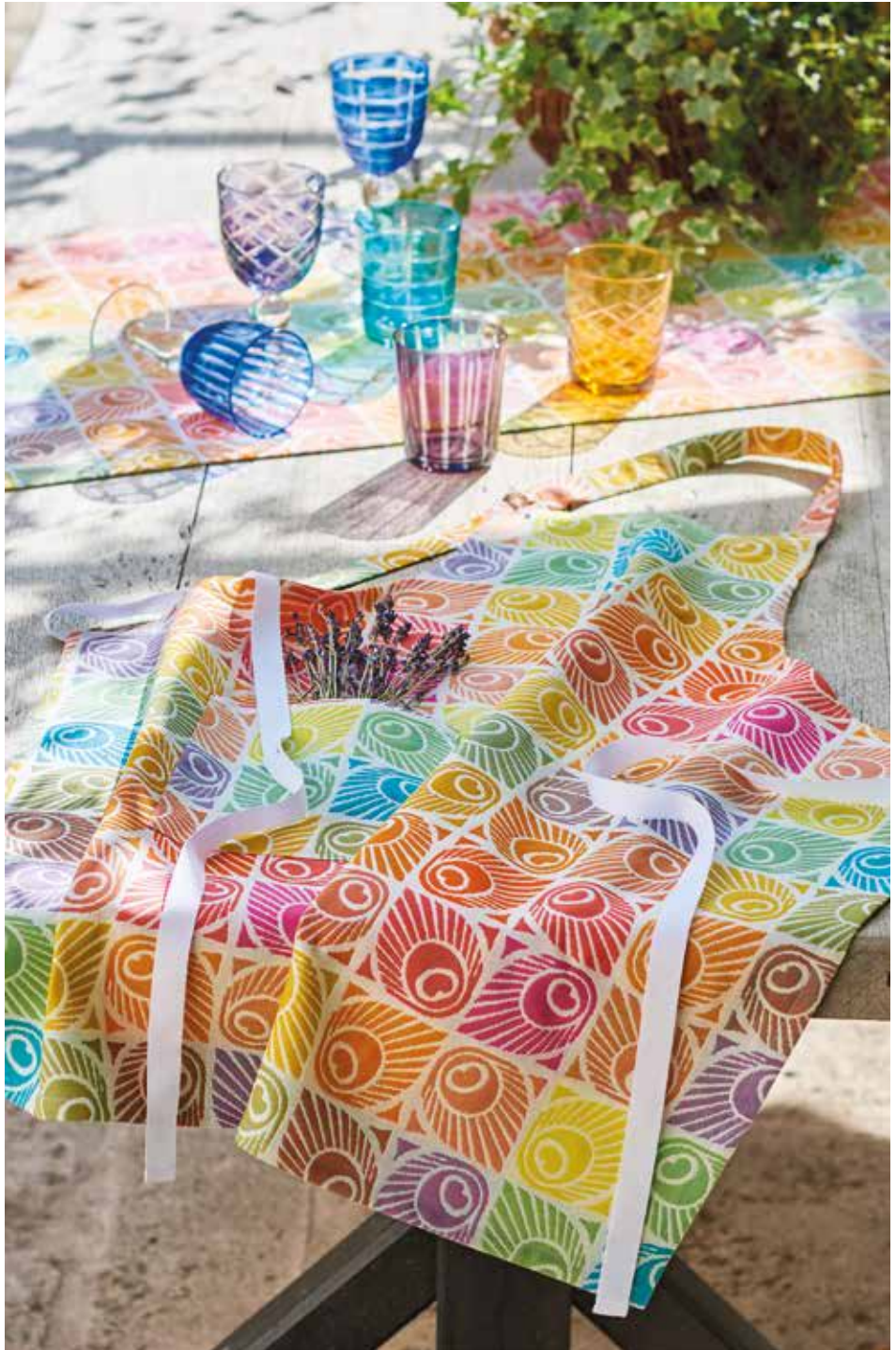
Mille paons festival - 100% coton damassé (existe en enduit) 100% damask cotton (also available in coated cotton)