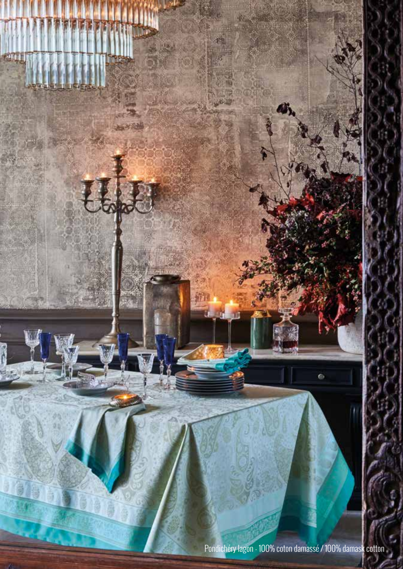
Pondichéry lagon - 100% coton damassé / 100% damask cotton