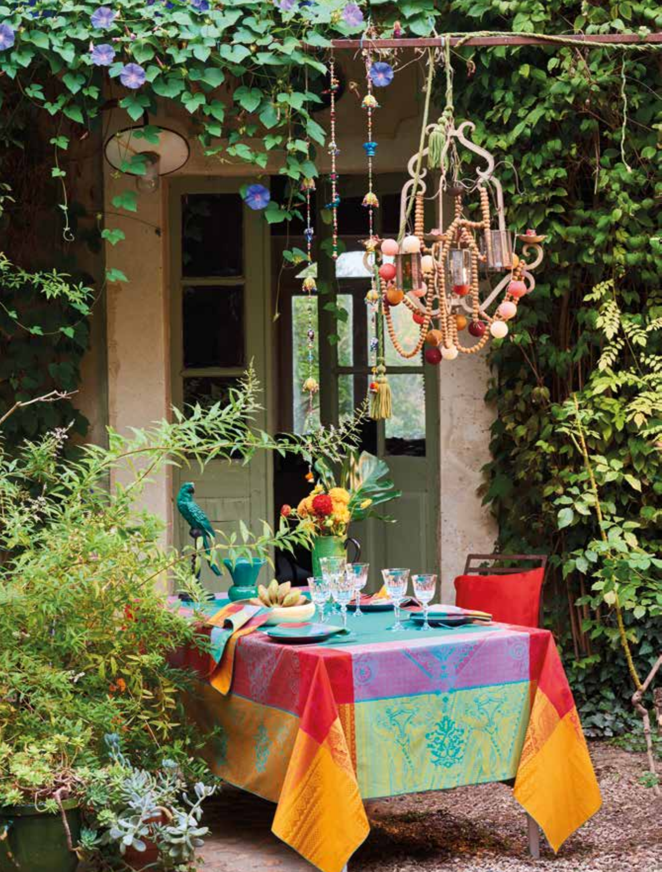
Jodhpur festival - 100% coton damassé / 100% damask cotton