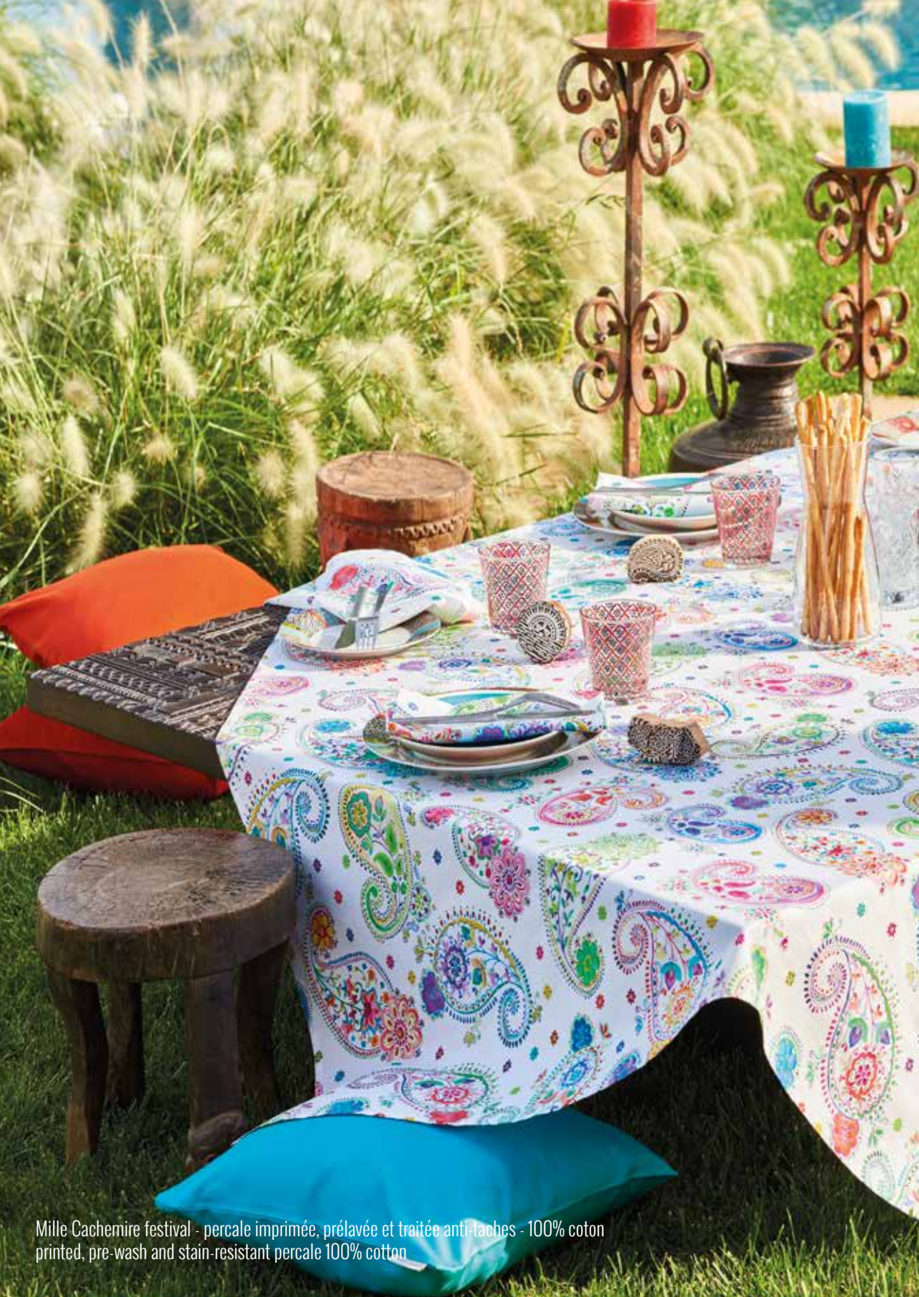
Mille Cachemire festival - percale imprimée, prélavée et traitée anti-taches - 100% coton printed, pre-wash and stain-resistant percale 100% cotton