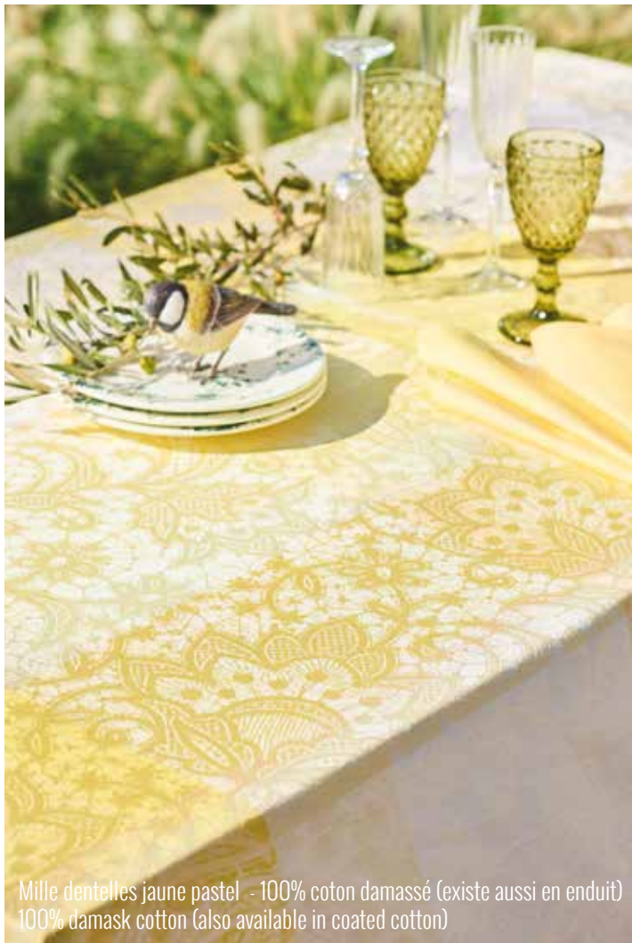
Mille dentelles jaune pastel - 100% coton damassé (existe aussi en enduit) 100% damask cotton (also available in coated cotton)