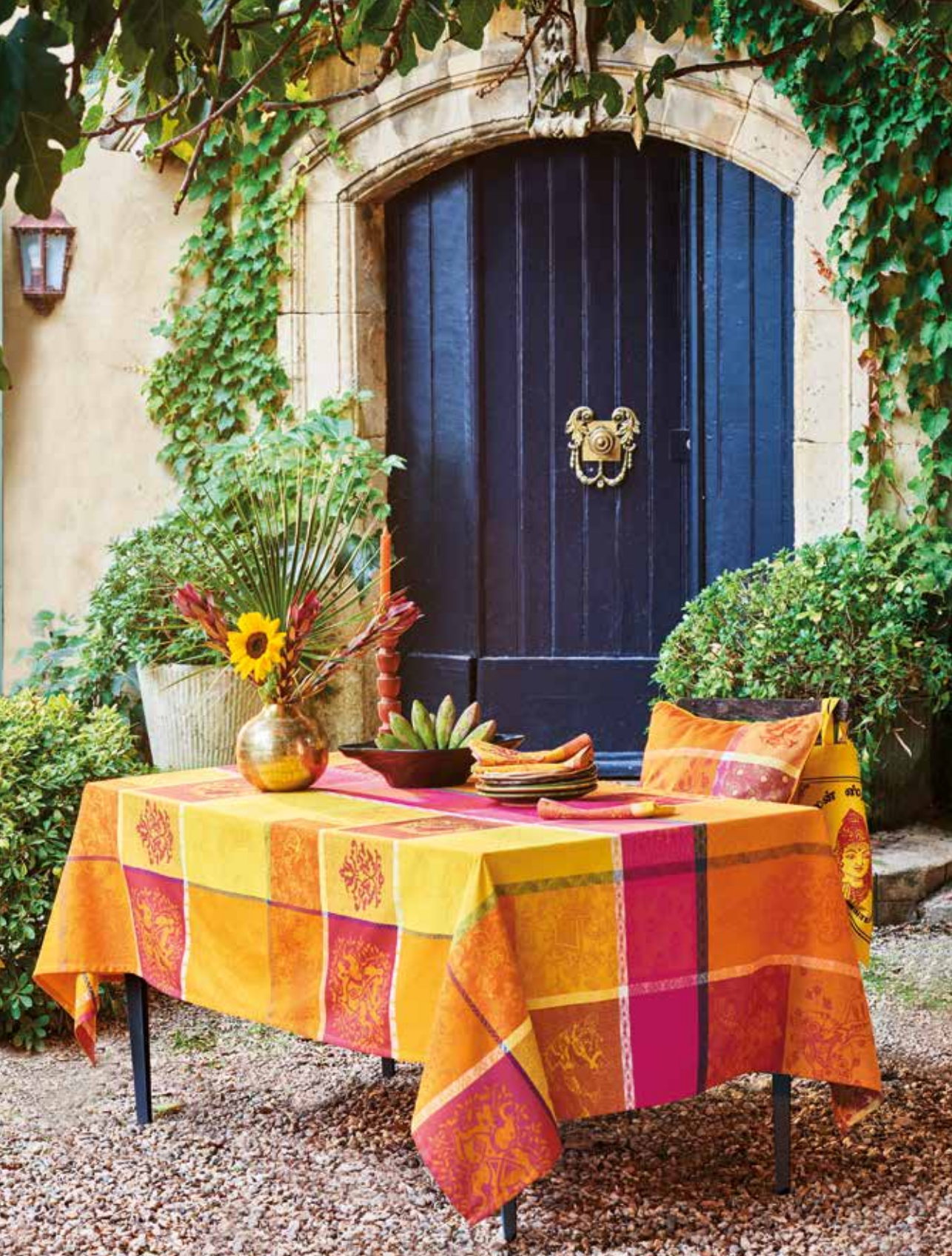
Mille holi épices - 100% coton damassé (existe aussi en enduit) / 100% damask cotton (also available in coated cotton)