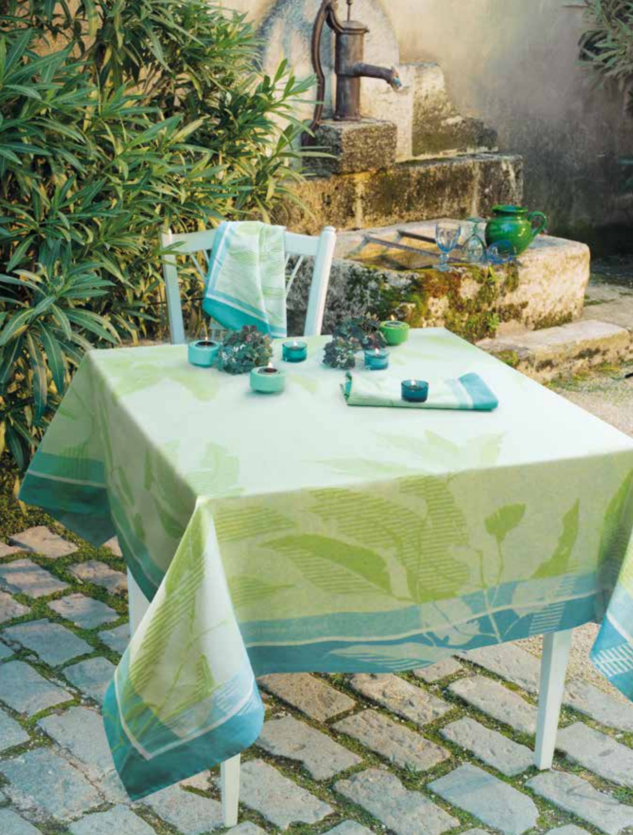
Livia chlorophylle - 100% coton damassé / 100% damask cotton