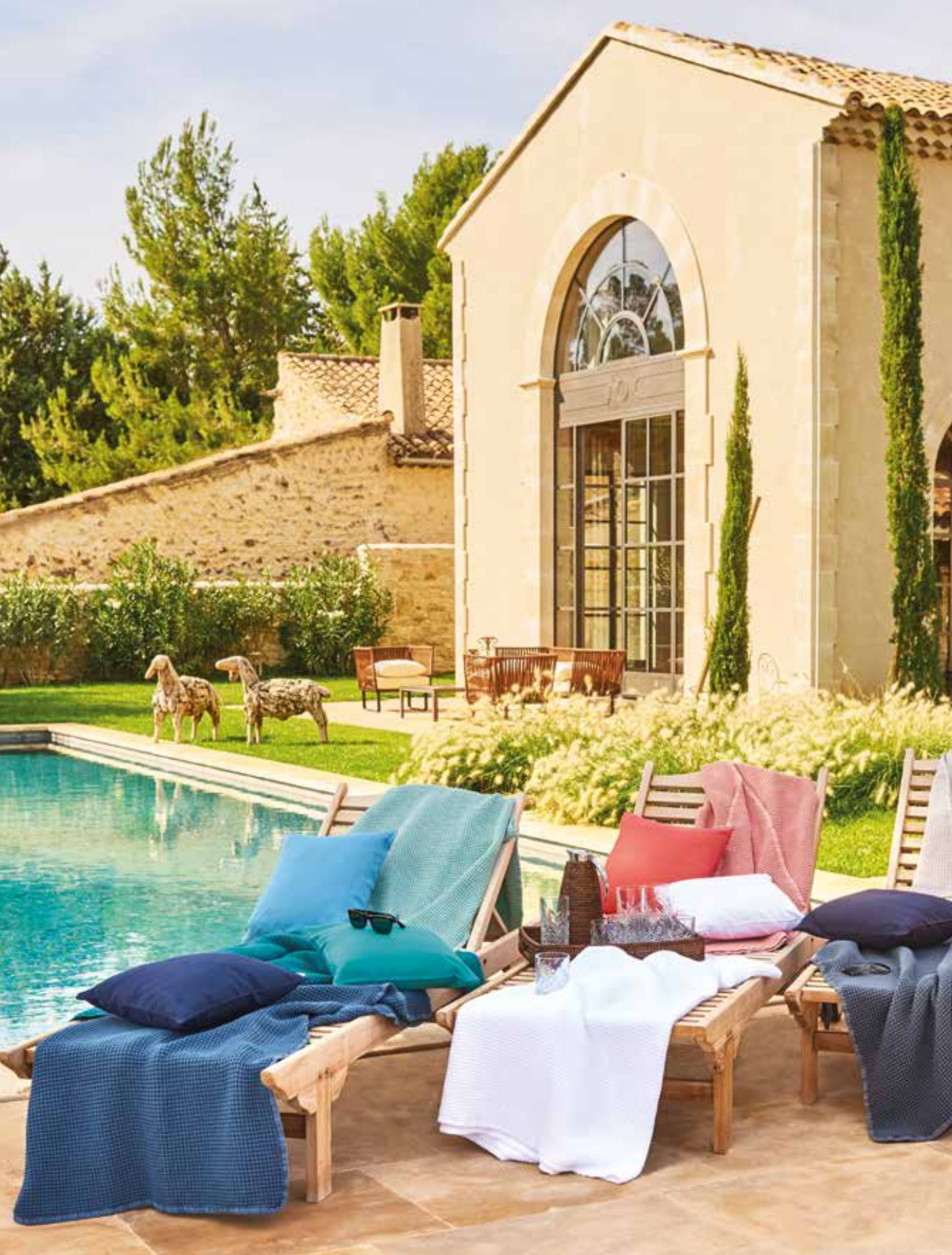
Plaids Santorin - nid d'abeille stone wash & Coussins Confettis - 100% coton / 100% cotton