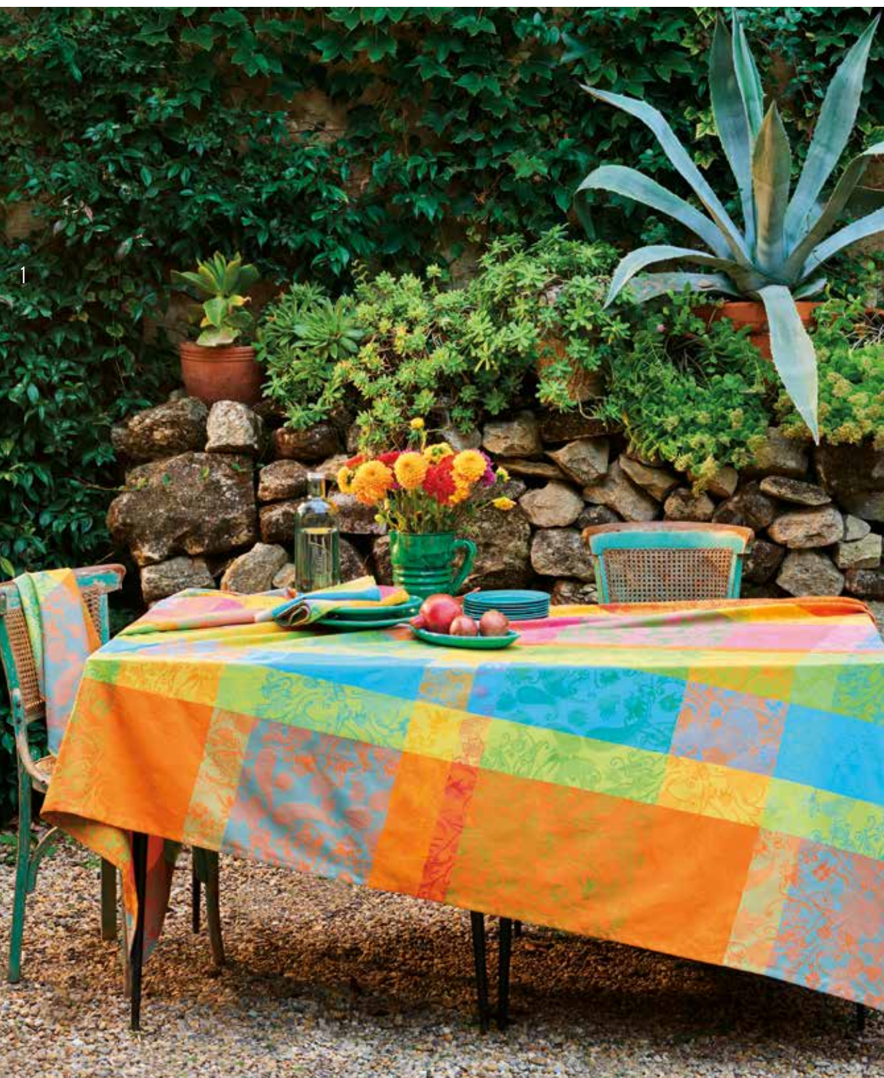
Mille india festival - 100% coton damassé (existe aussi en enduit) / 100% damask cotton (also available in coated cotton)