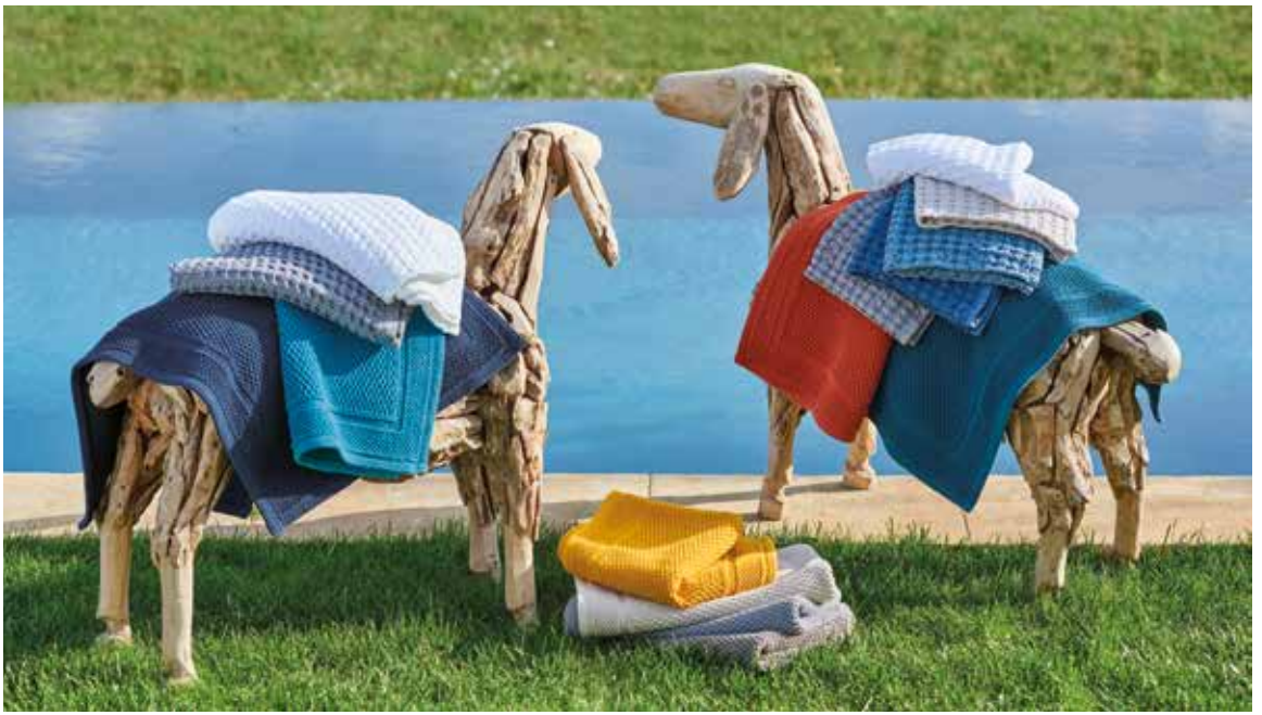
Tapis Antica & éponges nid d'abeille Cordoue