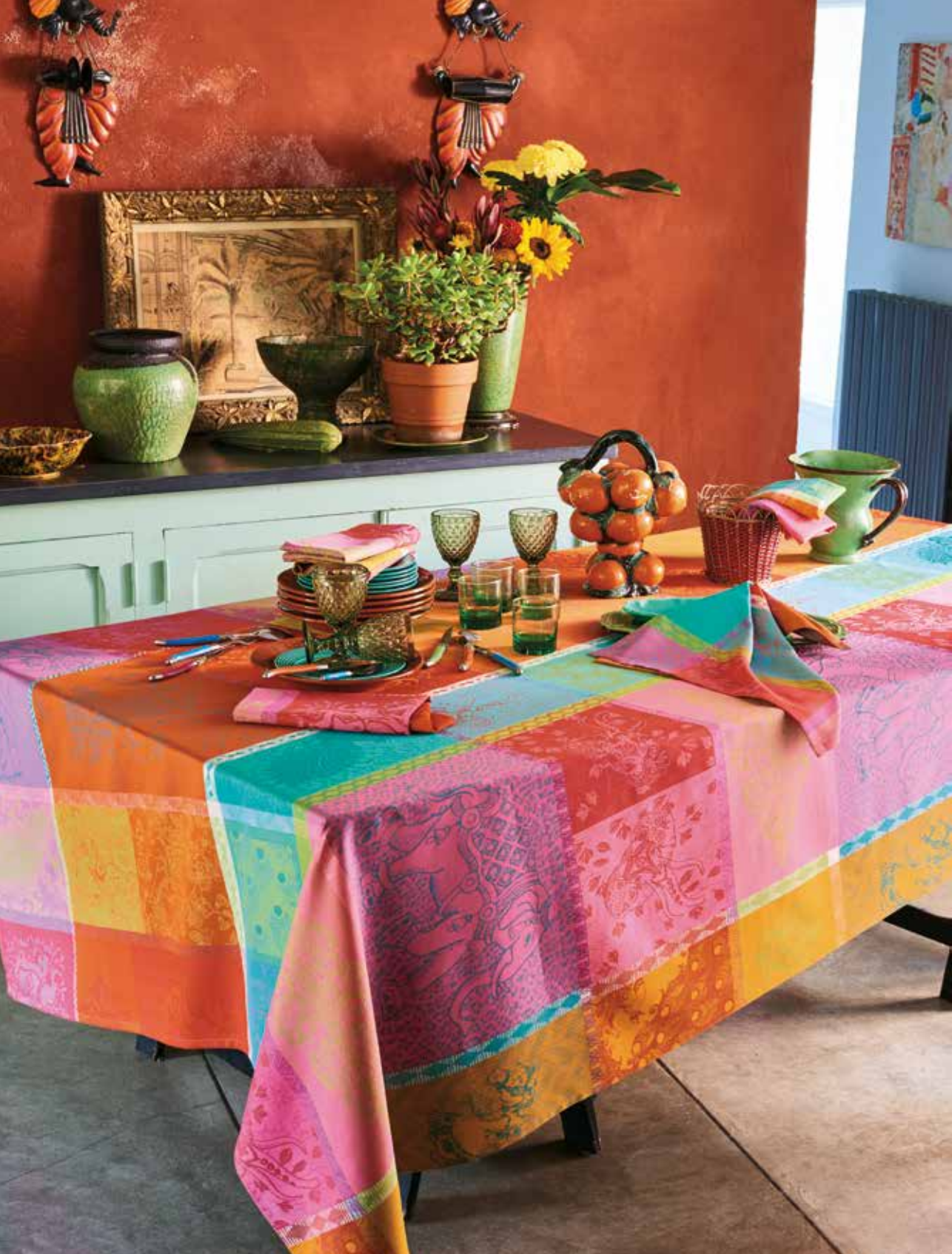
Mille holi festival - 100% coton damassé (existe en enduit) / 100% damask cotton (also available in coated cotton)