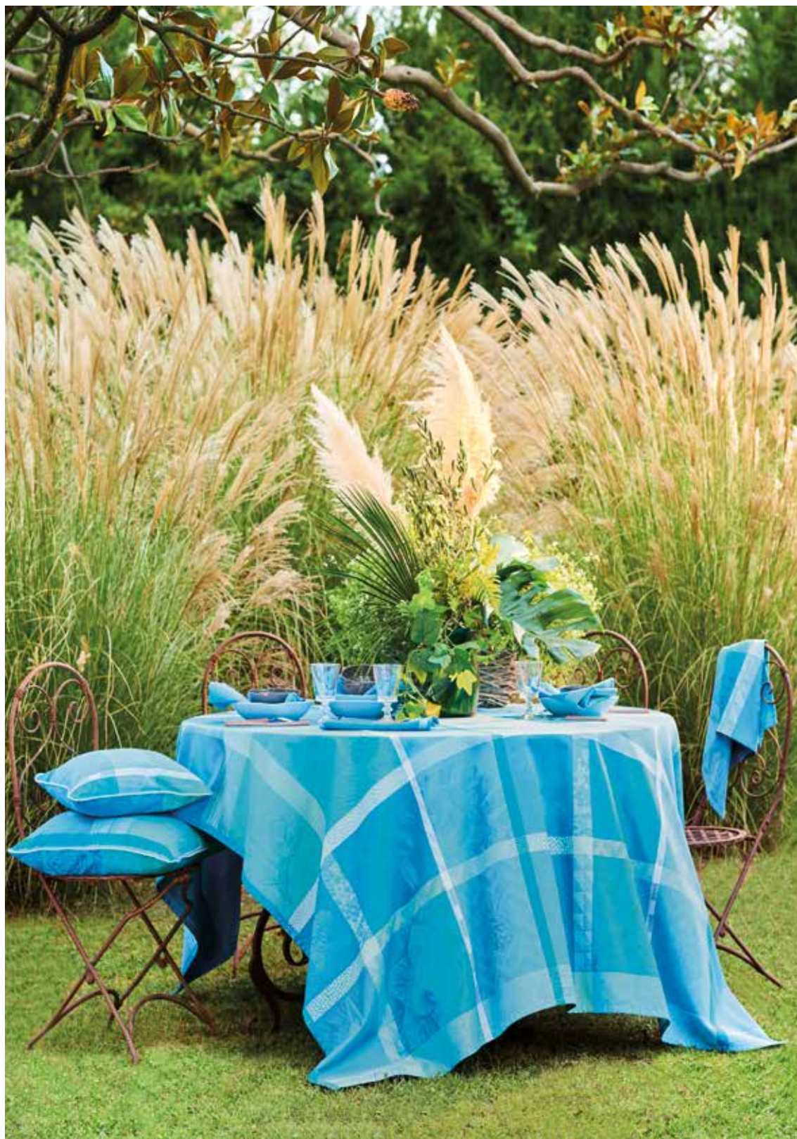
Mille gardenias lagon - 100% coton damassé (existe aussi en enduit) / 100% damask cotton (also available in coated cotton) 21