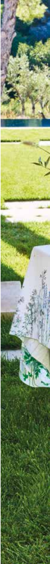
Jardin aromatique floraison - Métis lavé imprimé / pre-wash printed half linen