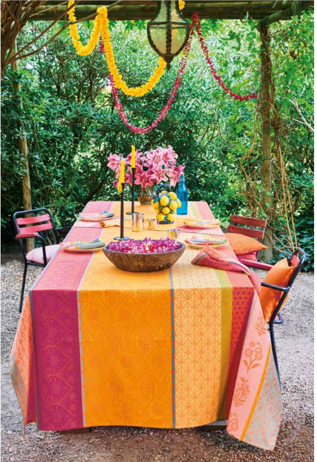
Mille Saris pendjab - 100% coton damassé / 100% damask cotton